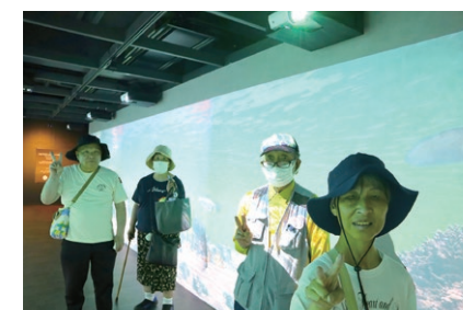
壁に映し出されたデジタルアート

6月18日にデイナイトケア・デイケア合同の遠足で兵庫県南あわじ市にある「うずの丘大鳴門記念館」へ行きました。館内でしか購入できない限定のハンバーガーやアイスを食べられる方や、限定ショップで買い物をされる方、名物の巨大な玉ねぎオブジェクトを見て驚く方など、各々が様々な形で館内を楽しまれました。中でもみなさん興味を持たれていたのが、淡路島の海中を表現したデジタルアートでした。幻想的な体験ができた感想を述べる方もいました。帰りのバスの中でも「玉ねぎめっちゃ大きかった!」や「暑かったけど来てよかった!」等、多くの感想を頂くことが出来ました。