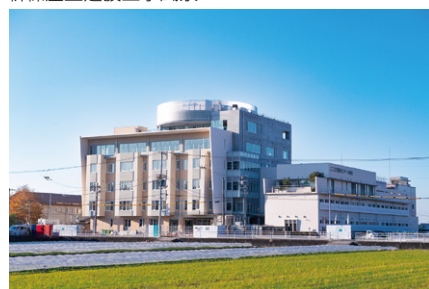
新棟正面建設工事風景