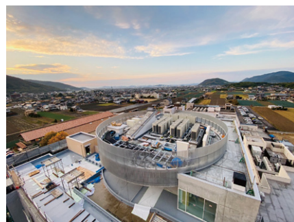
新棟屋上建設工事風景