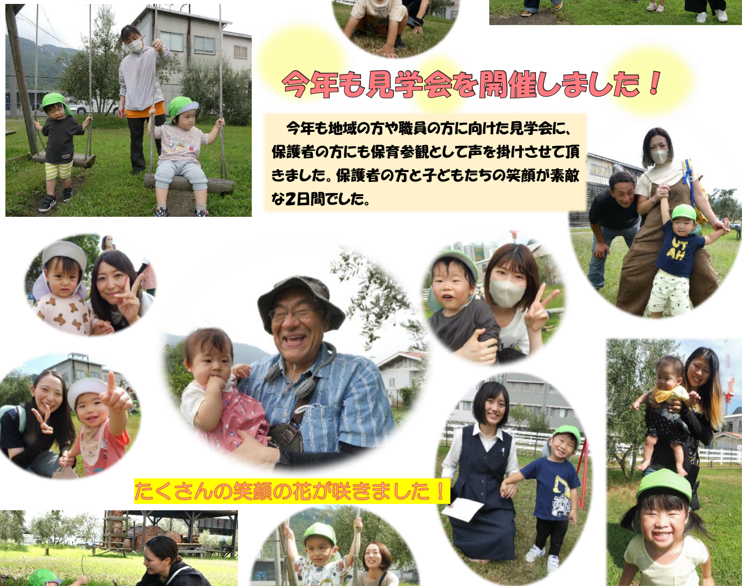
たくさん笑顔の花が咲きました！

今年も地域の方や職員の方に向けた見学会に、保護者の方にも保育参観として声を掛けさせて頂きました。保護者の方と子どもたちの笑顔が素敵な2日間でした。