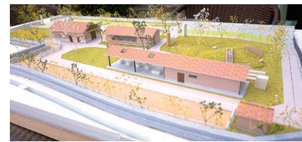
新しいセラピーガーデンのイメージです

こころの医療センター五色台の新棟建設工事は、現在基礎工事の段階で、1期工事は来年、すべての完成は2025年4月の予定です。新棟には外来部門、事務・管理部門、児童思春期病棟、精神科救急病棟等が入ります。また、新棟の東側には新しいセラピーガーデンも同時に建設中です。