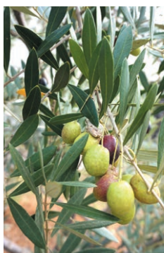
2021年のオリーブオイルも、乞うご期待!!