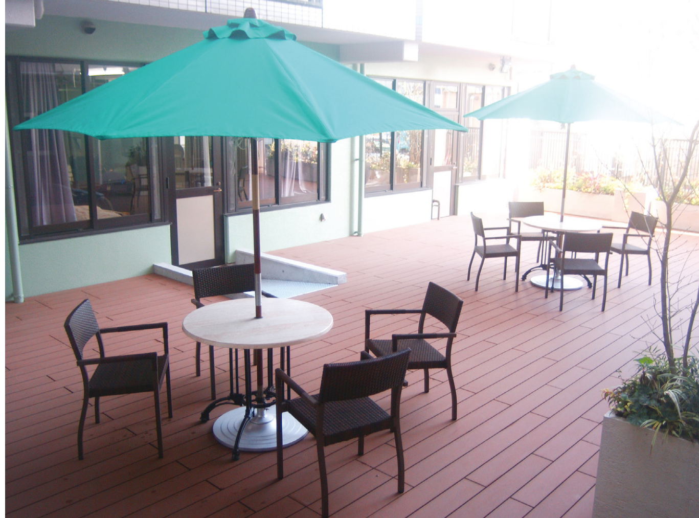
写真はハートテラスの様子です。