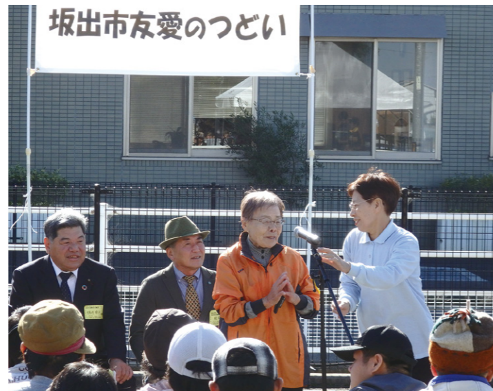
坂出市友愛のつどい

友愛のつどいは、障害のある方々が陶芸や乗馬体験などの活動を通し、交流を図るイベントです。当日は各ブースで多くの笑顔が見られ、自然と交流が生まれる場面もありました。乗馬ブースでは、なんと坂出市長が飛び入り参加！以前に乗馬をさせていただき、馬の扱いはお手の物。ポニーのももちゃんもリラックスしている様子でした。