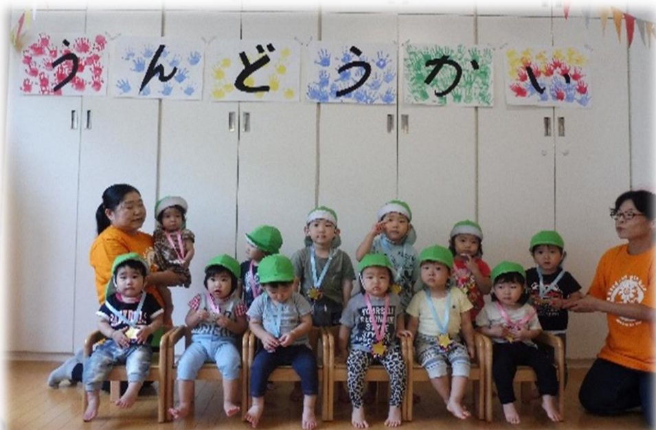
運動会でメダルをもらったよ♪

〒762-0023 坂州市加茂町678番地1 TEL: 0877-59-4330