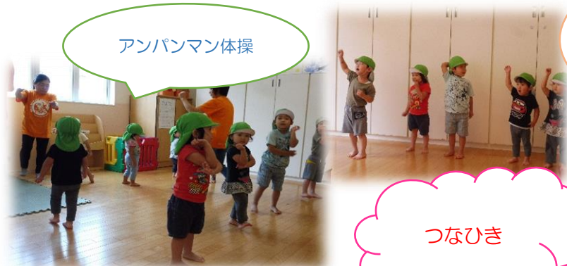
アンパンマン体操